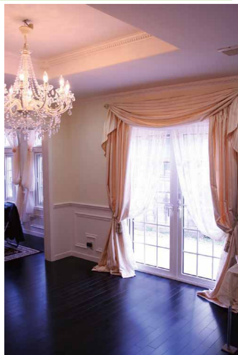
リビングのカーテン ヨーロッパ風にゆったり床におろして優雅さを