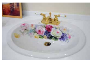
洗面ボール/バラ好きでなくてもこのデザインを見たら感動モノ。ちょっとゴージャスで優しい洗面ボール。手書きです。