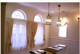
照明/アンティークともモダンとも見える吊り下げランプ ダイニングテーブルを照らします。